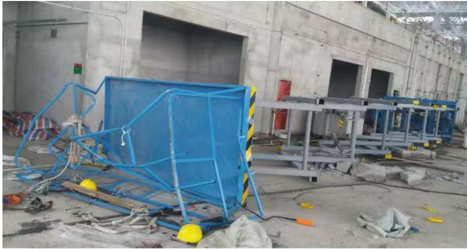
示例一、移动倾覆案例